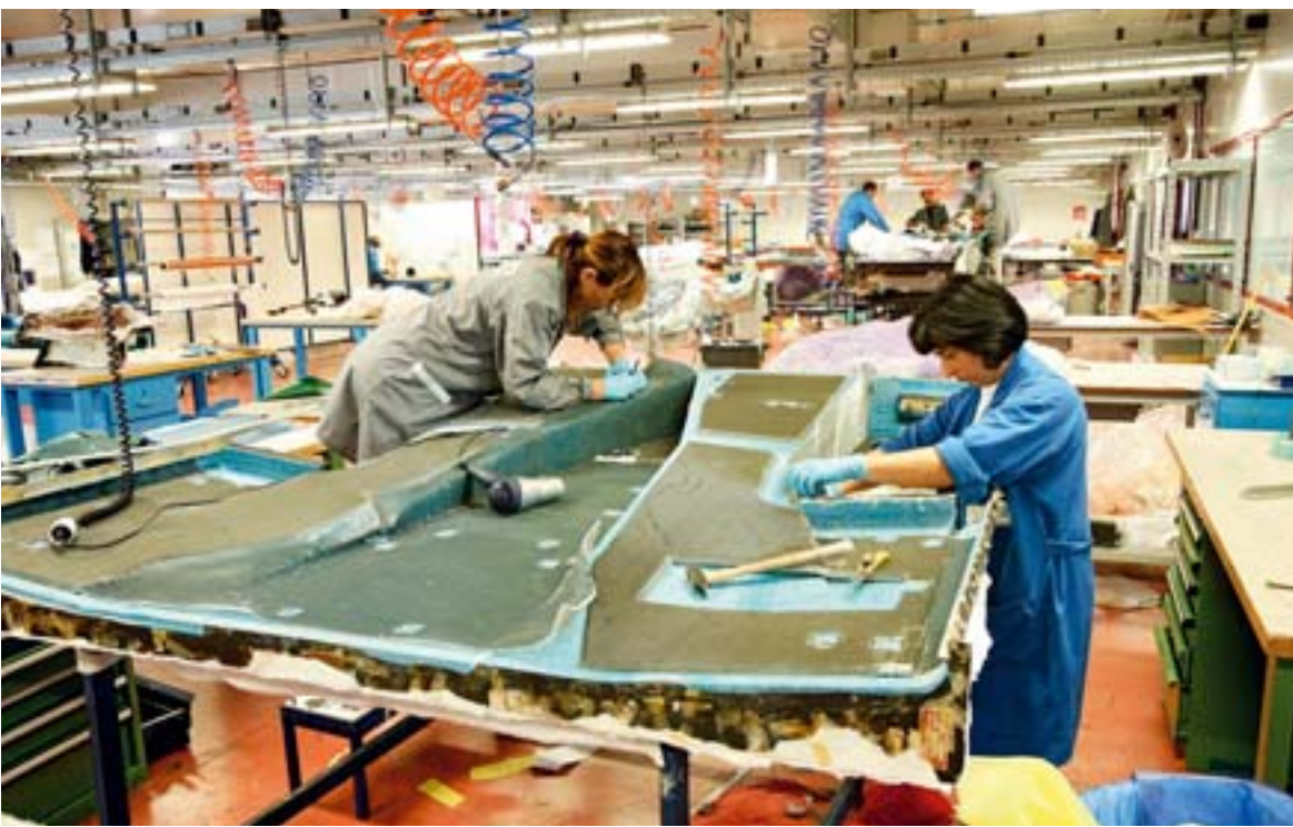
Moderne Werkstoffe im Automobilbau sind die Spezialität von ATR. Auch ein revolutionärer Einsatz von Carbon in der automotiven Tragwerkstruktur geht auf das Unternehmen aus Colonella zurück

Die Tradition bewahren, ohne auf den Fortschritt zu verzichten: Seit jeher zeichnen sich die Bewohner der zwischen Hochgebirge und Adriaküste gelegenen Abruzzen darin aus, die Entwicklung vieler Lebens- und Arbeitsbereiche nachhaltig zu gestalten. „Die grüne Region Europas“, wie die Abruzzen auch genannt werden, beeindruckt durch die Dimensionen des Gran Sasso-Gebirges als höchstem Teil des Apennin ebenso wie