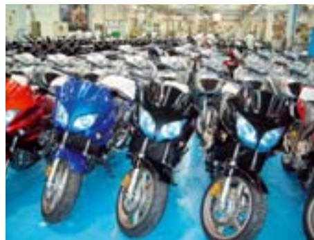
40 % aller Komponenten in Honda-Motorrädern steuern Zulieferer bei, die im Umkreis der Fertigungsstätte in Atessa siedeln