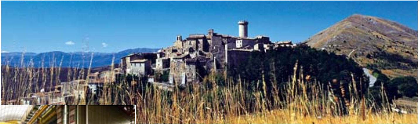
Ein Hotelprojekt im mittelalterlichen Santo Stefano di Sessanio erweckt das Kleinod zu neuer Blüte

Der Detektor im Gran Sasso-Physiklabor soll neue Erkenntnisse über Neutrinos liefern