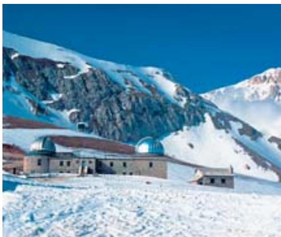
In der Gastronomie wie im Kunsthandwerk- und Freizeitbereich spiegeln sich die Besonderheiten eines Landes wider, dessen Klima und Umgebung auf engem Raum völlig verschieden sind. Pastaproduzent Delverde (oben) nutzt reines Quellwasser aus der Maiella. Nicht allzuweit entfernt davon ist das Skigebiet Campo Imperatore (unten) im Gran Sasso