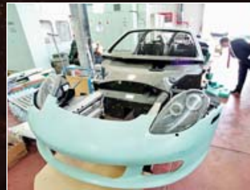
Innovation als Motor