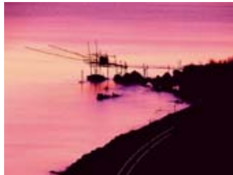
Die Trabocchi, zur Fischerei genutzte alte Pfahlbauten über dem Meer, kennzeichnen einen Küstenstrich in der Provinz Chieti